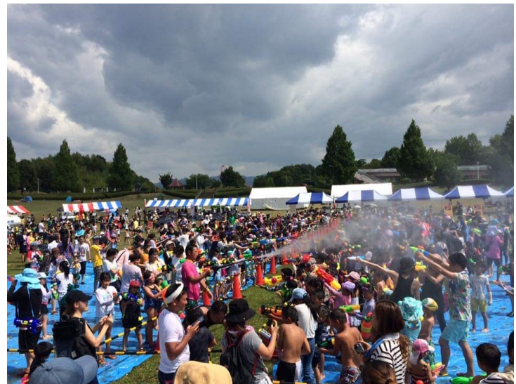
KISHIWADA ウォーターフェス2017 開催風景